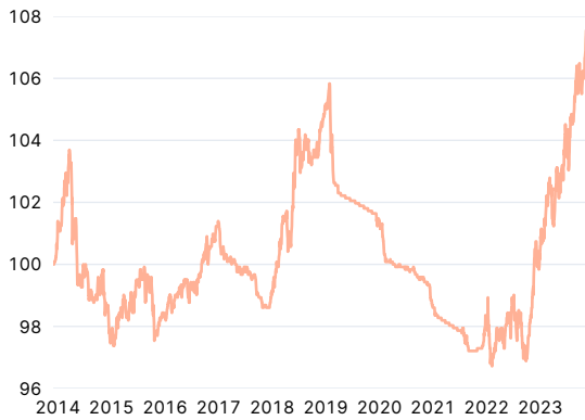
Wertentwicklung (inkl. Ausschüttung) zwischen 30.12.2014 und 30.12.2024