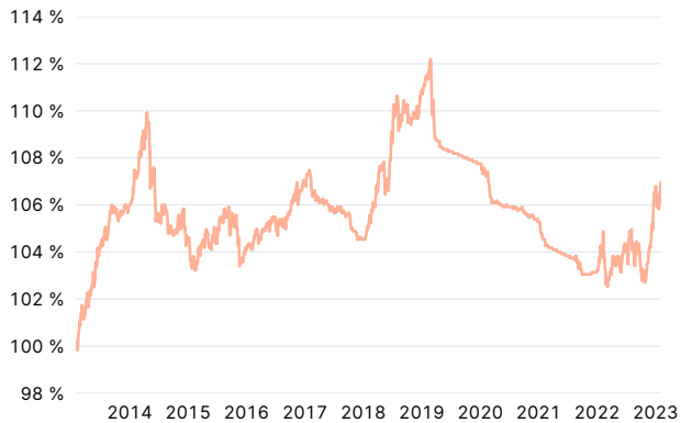
Wertentwicklung (inkl. Ausschüttung) zwischen 31.01.2014 und 31.01.2024